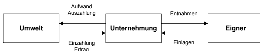
Abb. 1: Der Unterschied zwischen „Zielgröße“ und Gewinn.

Den Unterschied zwischen „Zielgröße“ und dem nach den gesetzlichen Vorschriften ermittelten periodisierten Gewinn stellt Wagner regelmäßig in der in Abb. 1 dargestellten Weise dar. Diese Zeichnung ist das (ausgedrückt als schwäbischer Superlativ) „Einzigste“, das in Form von traditionellen Kreidezeichnungen den Weg an die Tafel findet. „Sexy“ Folien hat Wagner nicht nötig. Als brillanter Redner versteht er es, das Auditorium in seinen Bann zu ziehen.